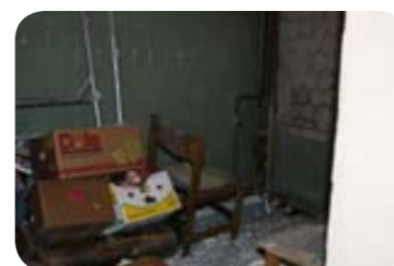
Det kan være svært at forestille sig det dette som Cesis' kommende børnekirke.

Som mange ved, har vi fra Århus gennem flere år sendt hjælp til Letland og har bl.a. flere gange om året videresendt genbrugstøj og brugsting. Som et led i vores Letlandsarbejde rejste en gruppe fra menigheden til Riga i september. Formålet med rejsen var at opretholde vores relationer til menighederne i Letland, samt forsøge at skabe nye relationer til både præster og menighedsmedlemmer. Vi har erfaret, at det kan være svært at holde den fornødne kontakt via mail og internet, og at den årlige rejse, er en vigtig forudsætning for at kunne hjælpe bedst muligt. Dette skyldes ikke mindst, at vi har en sproglig udfordring, da det kun er den unge generation i Letland, som taler engelsk. Vores indsamlede tøj m.v. bliver fordelt mellem menighederne og bliver bl.a. brugt til uddeling i lokalområderne. Men menighederne