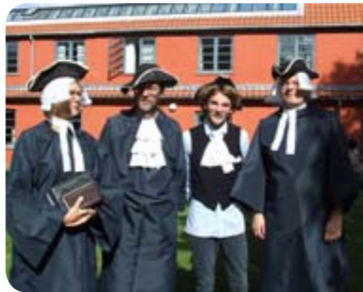
Det var John Wesley selv, der begyndte med konferencerne

Pastoratskonferencen udtrykker menighedens demokratiske ledelsesform, og kvaliteten af denne ledelse er afhængig af, at den bedste demokratiske kultur udvikles. Pastoratskonferencen udtrykker også menighedens teokratiske ledelsesform, fordi menigheden gør, som den første kirke gjorde. I Apostlenes Gerninger kan vi læse om den første konference, hvor menigheden i Jerusalem diskuterede og stillede forslag og bad for de beslutninger, som skulle træffes, og da de var nået frem til et resultat, var det deres opfattelse, at Gud havde været med i processen. Derfor kunne de sige: Helligånden og vi har besluttet. Det er ikke så ofte, vi hører, at en pastoratskonference i en lokal metodistkirke i Danmark beslutter sig for en målsætning, godkender et